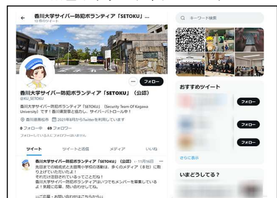
図3：SETOKUの公式アカウント

twitter 公式アカウント： https://twitter.com/ku_setoku