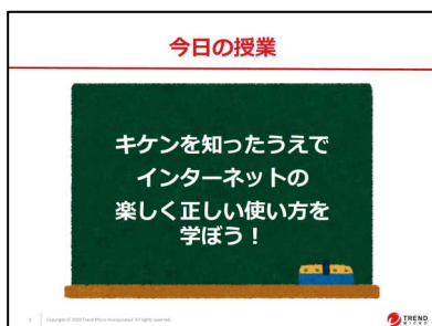
図1：小学校向けの教材例1