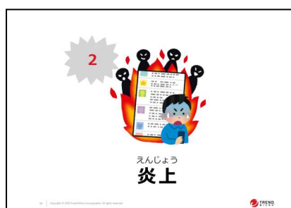
図2：小学校向けの教材例2