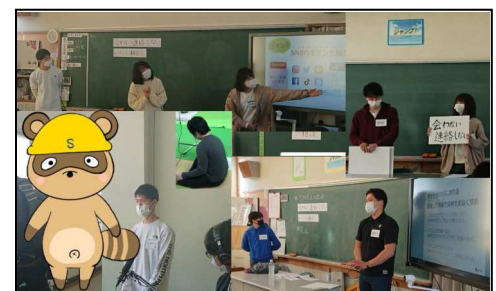
図3：これまでの小学校での指導の様子